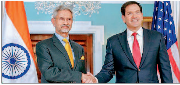
वॉशिंगटन में डॉ. एस. जयशंकर और मार्को रूबियो के बीच मुलाकात