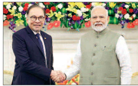
हरिभूमि न्यूज ॥ नई दिल्ली

यह पीएम मोदी को मलेशिया की तीसरी यात्रा होगी और अगस्त 2024 में भारत-मलेशिया द्विपक्षीय संबंधों को 'व्यापक रणनीतिक साझेदारी' का दर्जा दिए जाने के बाद पहली यात्रा होगी। इस यात्रा के दौरान वे पीएम अनवर इब्राहिम के साथ द्विपक्षीय चर्चा करेंगे। पीएम मोदी 7-8 फरवरी को मलेशिया की आधिकारिक यात्रा पर जाएंगे। इस दौरान वह मलेशिया के पीएम के साथ कई महत्वपूर्ण मुद्दों पर बातचीत करेंगे। भारतीय विदेश मंत्रालय के अनुसार पीएम मोदी को मलेशिया के पीएम दातो सेरी अनवर इब्राहिम ने आमंत्रित किया है। यह पीएम मोदी को मलेशिया की तीसरी यात्रा होगी और अगस्त 2024 में भारत-मलेशिया द्विपक्षीय संबंधों को 'व्यापक रणनीतिक साझेदारी' का दर्जा दिए जाने के बाद पहली यात्रा होगी।