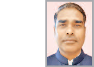
(पूर्व अख्युक्त, संस्कृति विभाग, छत्तीसगढ़ शासन)

चित्रोत्पला फिल्म सिटी छत्तीसगढ़ के लिए एक ऐतिहासिक अवसर है। लेकिन यदि इसकी नींव में संवेदनशीलता और संवाद की कमी रही, तो बच्चे संरचनाएं भी सांस्कृतिक रूप से अधूरी रह जाएंगी। आलोचना को निरोध नहीं, समय रहते मिला संकेत समझना चाहिए। क्योंकि संस्कृति में संकेतों की अन्देखी, सबसे महंगी भूल होती है।